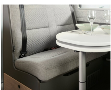
+ Klädsel Scandi