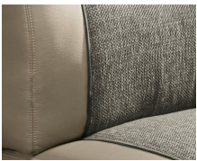
+ Klädsel Camino