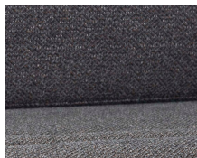
+ Klädsel Melia ○