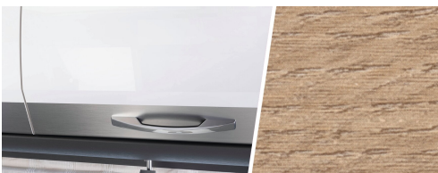
+ Trädekor Amberes Oak