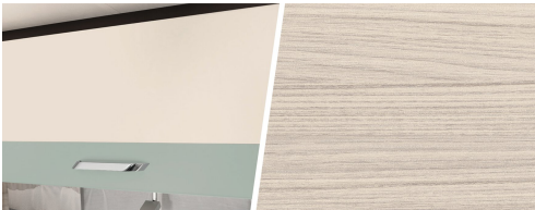
+ Trädekor Tindari Bora