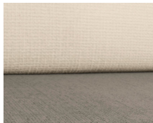
+ Klädsel Kapan