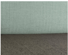
+ Klädsel Timor